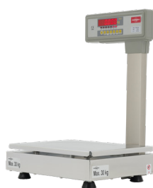
BMX0 Check-Out Tower